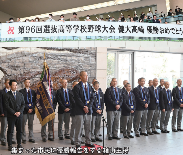
祝 第96回選抜高等学校野球大会 健大高崎 優勝おめでとう