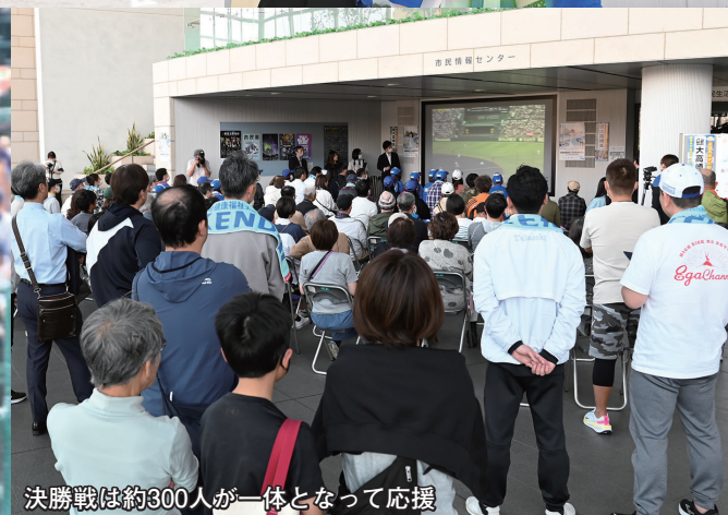
決勝戦は約300人が一体となって応援