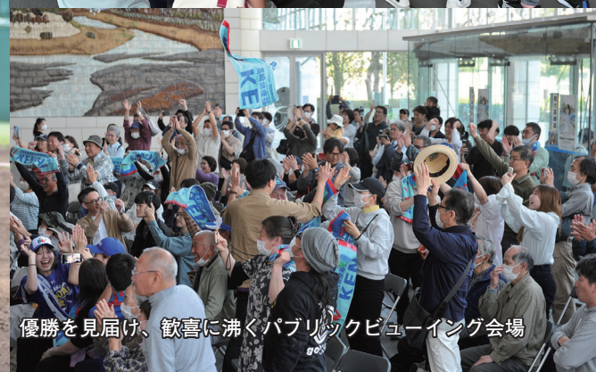
優勝を見届け、歓喜に沸くパブリックビューイング会場