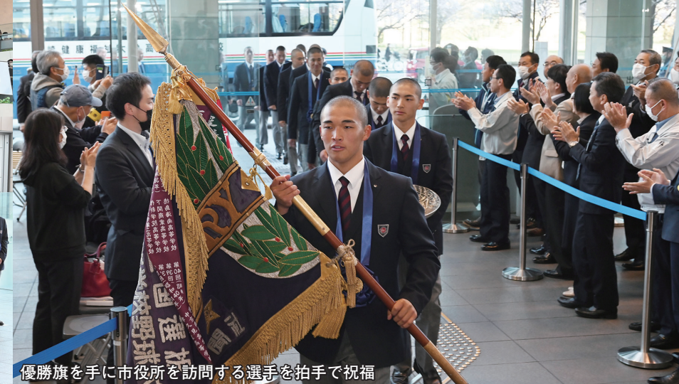
優勝旗を手に市役所を訪問する選手を拍手で祝福