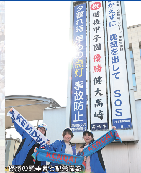
優勝の懸垂幕と記念撮影