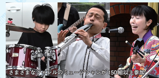
さまざまなジャンルのミュージシャンが150組以上参加