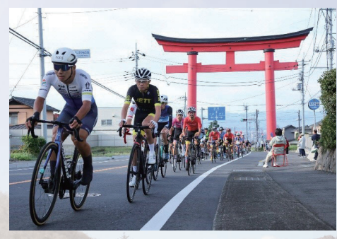
全長 22.6kmを駆け上がる

赤城山を舞台に、日本屈指のヒルクライムコースを駆け上がるまえばし赤城山ヒルクライム大会の出場者を募集します。申し込み方法など詳しくは、同大会のホームページで確認してください。 日時 9月29日(日)午前7時～11時 対象と定員 一般(中学生以上)=先着2,230人 e-bike(中学生以上)=先着20人 キッズ(小学4～6年生)=先着50人 費用 一般=9,000円 高校生=4,000円 中学生以下=無料 申込 5月下旬～7月10日(水)に同大会ホームページから応募