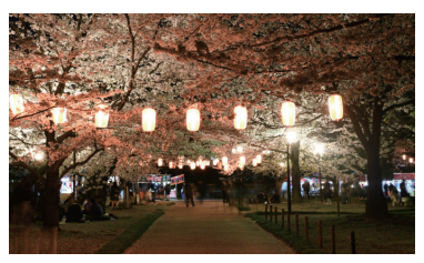
広報課から 4月11日撮影 高崎公園の夜桜ライトアップ

撮影した写真に「#美しい高崎」や「#beautifultakasaki」をつけてInstagramに投稿してください。毎月投稿された写真から掲載します。応募の際は注意事項を守ってください。