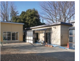
放課後児童クラブを支援

答弁 令和4年度に引き続き、物価高騰の影響を受ける放課後児童クラブに対し、光熱費の負担を軽減するための支援を行うもので、全101クラブのうち民営の97クラブが対象となる。