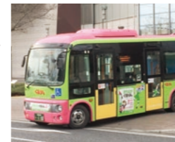
市内循環バス「ぐるりん」

答弁 市内循環バスぐるりんの八木線で使用している車両が、供用開始から20年経過し、老朽化が進んでいるため更新するものである。