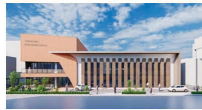
新労使会館の完成イメージ図

また、これに伴い令和6年度分を増額し、できる限り国庫補助事業として整備を進める。