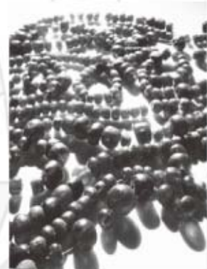
ガラス製丸玉 保原田八幡塚古墳(高崎市)