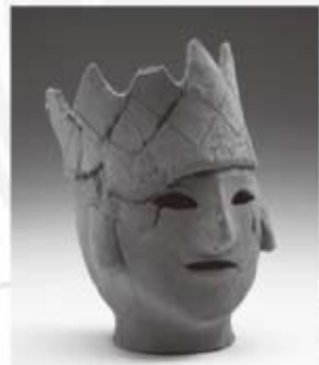
冠を被る王の埴輪 保原田八幡塚古墳(高崎市)