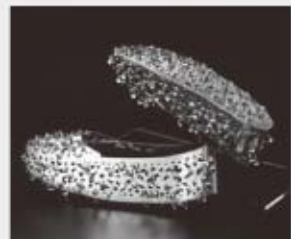
金銅製飾履(複製品) 高崎山下芝谷ツ古墳(高崎市)