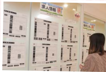
貼り出された求人情報を確認するママ