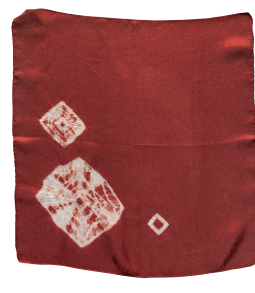
染料はインドアカネの根

園内で収穫した紅花の種を、来年1月5日(火)から来園者に無料で配布します。無くなり次第終了します。