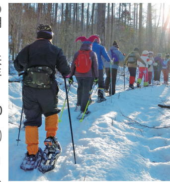
雪の感触を楽しむ

はまゆう山荘のイベント いずれも、申し込みは電話ではまゆう山荘(倉洲町川浦 ☎378・2333)へ。 ●期日 来年1月30日(土)・31日(日) ●集合場所 JR高崎駅東口(30日午後1時、マイクロバスで送迎) ●内容 西洋かんじき・スノーシューを履いて、はまゆう山荘周辺の森や浅間牧場などを歩く(スノーシューは貸し出します) ●定員 先着10人 ●費用 980円(食事代、保険料、はまゆう山荘の宿泊費込み) ●持ってくる物 防寒具、防水の靴(長靴不可)