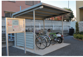
アパートの駐輪場や外構も対象

市内で事業を営んでいる個人や法人は、令和3年1月1日現在の償却資産の所有状況を、市役所2階資産税課か各支所税務課へ申告してください。申告期限は、2月1日(月)です。