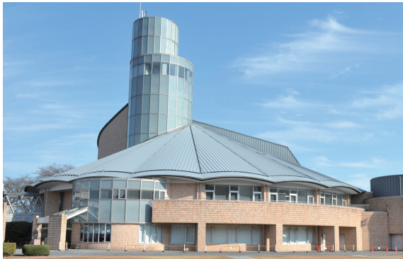
エコールの愛称で親しまれる榛名文化会館

年末年始の休館に伴い、文化施設の利用申請の受付開始日が変わります。通常、毎月1日から翌年同月分の利用予約を受け付けていますが、令和4年1月分の申請は、各施設によって異なるので注意してください。