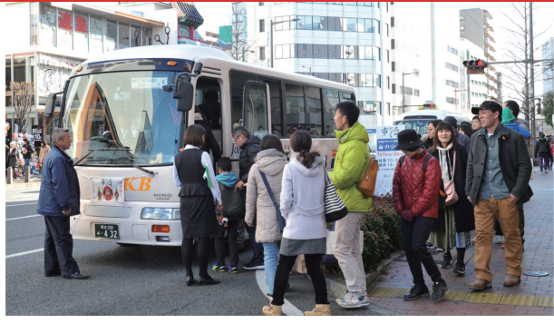
定員を減らし、巡回するバスの本数を増やす。車内は定期的な消毒・換気する