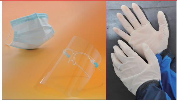
販売者・ステージイベント出演者全員にPCR検査を実施。マスクなどの着用を義務付け、金銭の受け渡しはトレーで行う