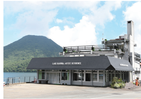
榛名湖アーティスト・レジデンス運営事業(総務費)