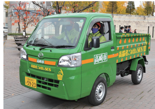
高齢者等ごみ出し支援事業(衛生費)