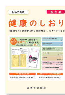
検診で体の状態を知る

市は、実施医療機関で健康づくり受診券を使って受診できるがん検診を実施しています。受診できるのは、胸部(肺がん・結核)、胃がん(内視鏡)、胃がん(リスク)、大腸がん、乳がん、子宮がん、前立腺がんの7項目です。今年度の受診期間は来年1月31日(日)までです。1月は医療機関が混み合うので、早めの予約・受診をお勧めします。 実施医療機関や対象、費用など詳しくは、健康のしおりで確認してください。市ホームページでも確認できます。 問い合わせは、健康課健康づくり担当へ。