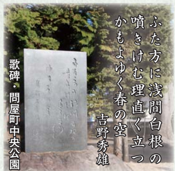
ふた方に浅間白根の 噴きけむ理直く立つ かもよゆく春の空 吉野秀雄