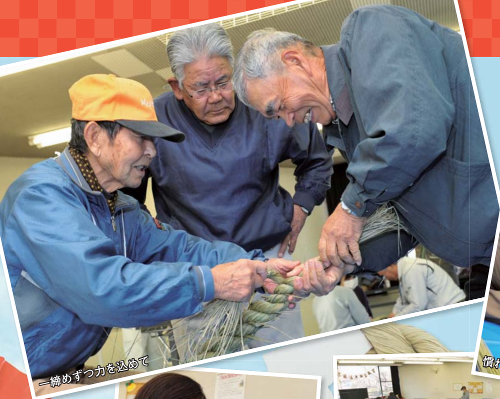
一締めずつ力を込めて