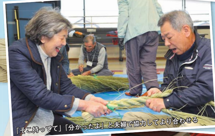
「そこ持って」「分かったよ」と夫婦で協力してより合わせる