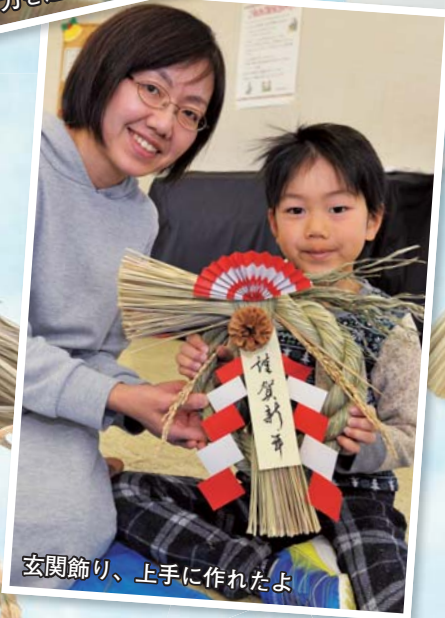
玄関飾り、上手に作れたよ