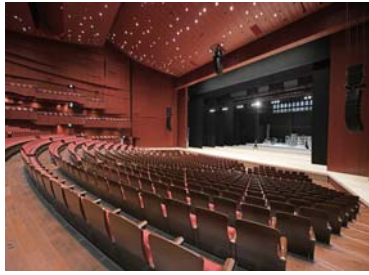
広々とした舞台の大劇場

高崎芸術劇場は、1月20日(月)に施設見学会を開催します。大劇場とスタジオシアター、音楽ホールを自由に見学できます。