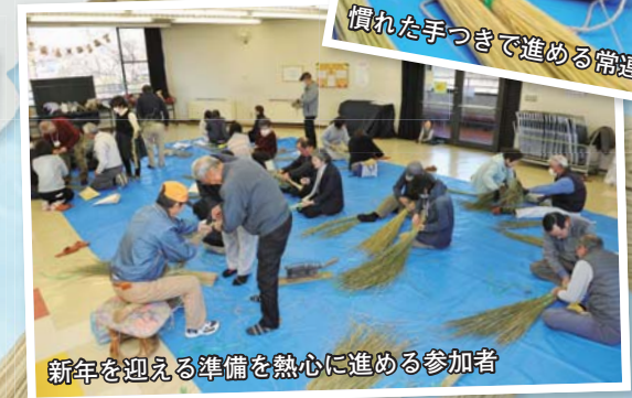
新年を迎える準備を熱心に進める参加者