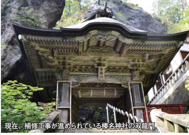
現在、補修工事が進められている様名神社の双龍門

●日時=1月26日午前10時～正午 ●集合場所=観音塚考古資料館 ●費用=無料 ●申し込み=当日直接集合場所へ