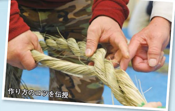
作り方のコツを伝授