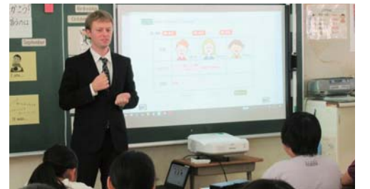
生きた英語を子どもたちに

市教育委員会は、4月から市内の小中学校・高校に勤務する外国人の英語指導助手を募集します。募集人数は、若干名です。