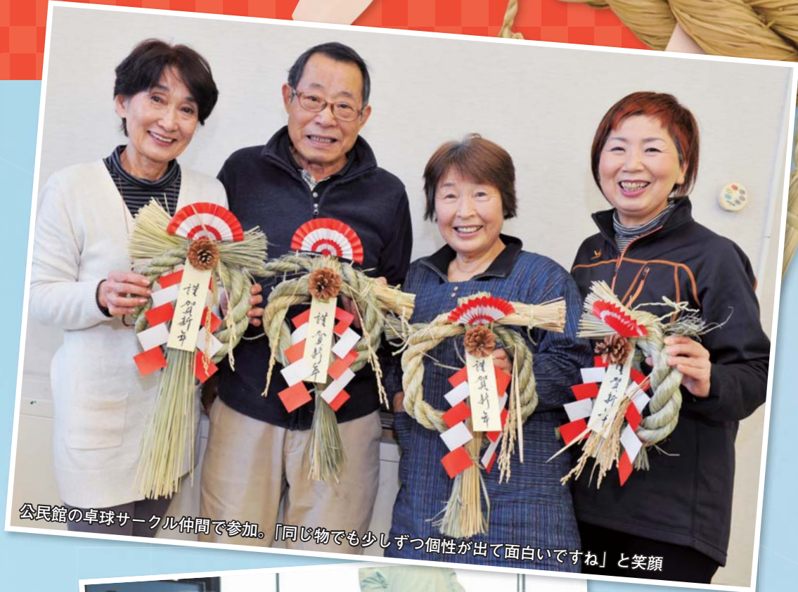
公民館の卓球サークル仲間に参加。「同じ物でも少しずつ個性が出て面白いですね」と笑顔