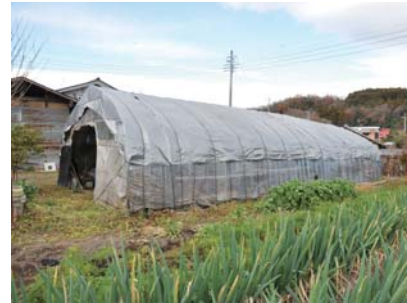
ビニールハウスも申告の対象です

市内で事業を営んでいる個人や法人は、令和2年1月1日現在の償却資産の所有状況について、市役所2階資産税課か各支所税務課へ申告してください。