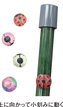
上に向かって小刻みに動く

科学工作・パソコン教室 日時 2月9日(日) 会場 パソコン室 内容 シューティングゲームを作り、簡単なコンピュータプログラムを体験する 定員 10人 費用 無料 木登りテントウムシを作ろう 日時 2月8日(土) 会場 創作室 内容 磁石の力を利用してパイプを登るテントウムシを作る 定員 20人 費用 500円