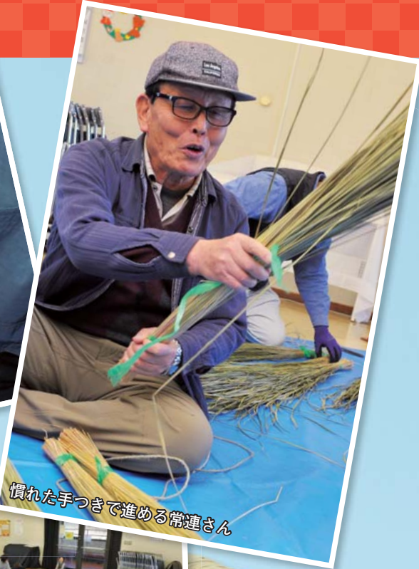
慣れた手つきで進める常連さん