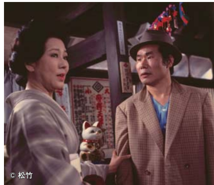
男はつらいよ～寅次郎純情詩集