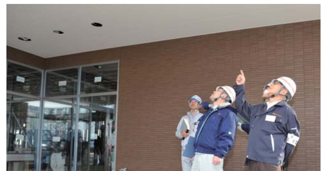
安全に利用できる施設かを確認

監査は、自治体工事監査の技術支援や技術指導・研修などを行っている大阪技術振興協会の協力により、市監査委員が実施。監査基準などに基づき、市が建設業者に発注した工事の設計や施工、工事現場の安全管理が適正に行われているかなど、書類と工事現場の両