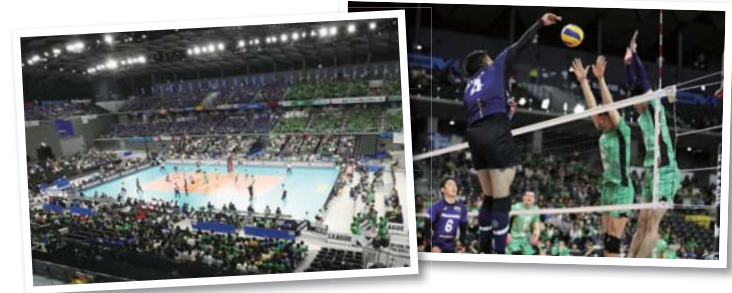
東京都で行われた昨年の大会の様子