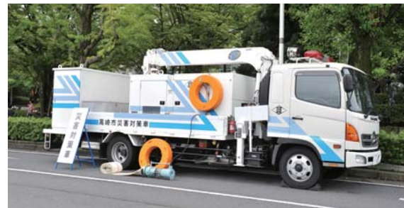
緊急時に排水作業を行う災害対策車