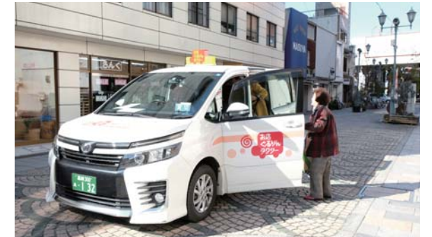
まちなかの回遊性向上を図る「お店ぐるりんタクシー」