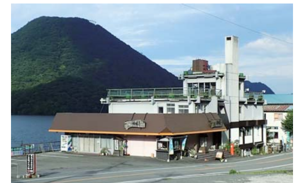
芸術活動を支援する榛名湖アーティスト・レジデンス