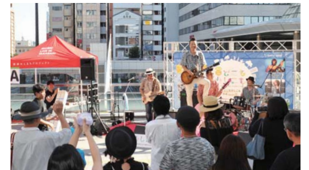
文化イベントの開催を支援