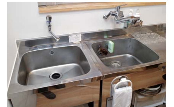
衛生面向上のために設けた特別枠

飲食店が食品衛生向上を目的に実施するリニューアルに、最大100万円を補助します。