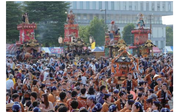
市制 120 周年を記念し 山車まつりへまちなかの全 38 台の山車出場を補助