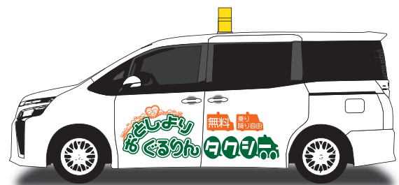
高齢者などの移動を支援するため6月から運行

乗り降り自由・予約不要・誰でも無料で利用できる、循環タクシーを新規に運行します。