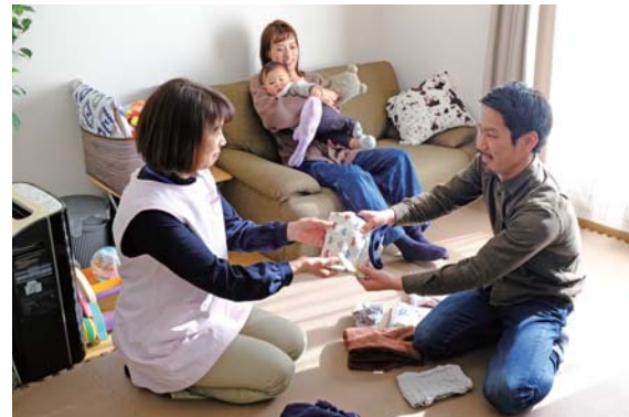
家事などをお助け「子育てSOSサービス」