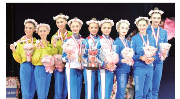
今年も高崎アリーナでさまざまな国際大会を開催