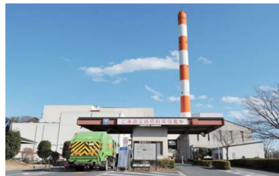
老朽化した高浜クリーンセンターを建て替え