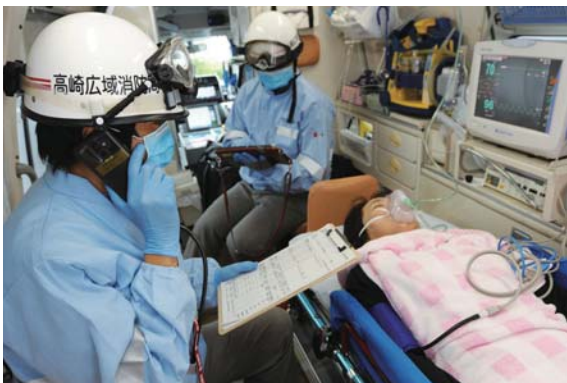
救急搬送患者のたらい回しゼロを目指す