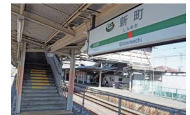
JR新町駅のバリアフリー化を促進