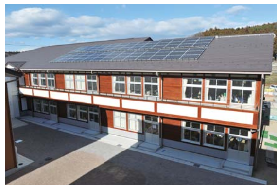
市内産の木材を使った箕輪小の校舎