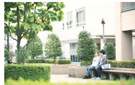
高崎経済大学の修学支援を充実

トイレ洋式化は対前年比3倍に拡充 外壁改修など学校施設の 環境改善を推進 ……………9億1,423万円