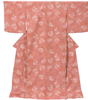
しのぎみさお 篠崎節作 型染着物 「つきぬぎにんどう」

■会期=4月24日(金)～6月7日(日) ■会場=染料植物園 (☎328-6808)