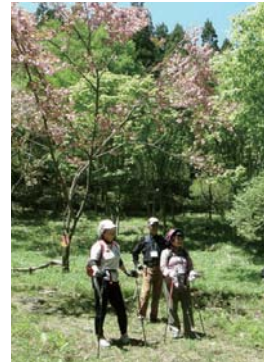
新緑と桜を眺めながら

日時 4月29日(祝)午前9時集合 集合場所 しまゆう山荘(倉洲町川浦) 内容 2本のポールを使って山道を歩くノルディックウォーキングで同山荘の周辺の森を散策(ポールは貸し出します)、温泉入浴 定員 先着20人 費用 3000円(昼食代、保険料、入浴代込み) 申し込み 電話ではまゆう山荘(☎378・2333)へ