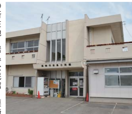
岩鼻公民館の外観

●所在地 岩鼻公民館Ⅱ栗崎町409の3 塚沢公民館Ⅱ飯玉町74の1 ●間取りⅡ和室（6畳）2、キッチン、バス、トイレ ●入居条件Ⅱ70歳未満で家族で入居できる人 ●管理人報酬Ⅱ月額5万2000円 ●入居費Ⅱ無料（電気・水道代は市が負担） ●入居日Ⅱ面接終了後、要相談 ●申し込みⅡ6月15日（月）までに、中央公民館（☎ 322・5071）か岩鼻公民館か塚沢公民館にある所定の履歴書に記入し、世帯主の市税の完納証明を添えて中央公民館へ。履歴書は市ホームページからダウンロードもできます。後日面接します