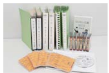
読書の楽しさをサポート

中央図書館は、録音図書・点字図書の郵送貸し出しや対面朗読サービスを行っています。代理人による申請もできます。登録方法など詳しくは、同館のホームページで確認してください。