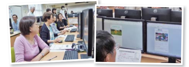
写真に合わせて文字の色なども変えよう

市は、デジタルカメラやスマートフォンで撮った写真をパソコンに取り込み、暑中見舞い状を作る講座を開催します。デジタル画像の保存・整理や、活用のための初歩的な技術を身に付けます。 ●日時＝7月12日（日）午前9時～正午 ●会場＝高崎商科大学附属高校（大橋町） ●対象＝市内に在住か通勤、在学中、文書作成ソフト（ワード）を使ったことのある人 ●定員＝30人（抽選） ●費用＝無料 ●申し込み＝6月5日（金）までに、往復はがきに住所・氏名・電話番号を書いて、〒370-8501 高崎市役所 社会教育課（☎ 321-1295）へ