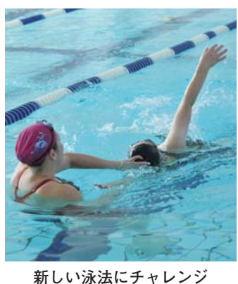
新しい泳法にチャレンジ

浜川温水プールの教室 いずれも、対象は市内に在住か通勤、在学の18歳以上の人です。プール入場料410円が毎回別途必要です。申し込みは、締め切り日までに、往復はがきに住所・氏名・年齢・電話番号・教室名・クラス名を書いて、〒370-0081 浜川町1575の1 浜川プール(☎344・5511)へ。