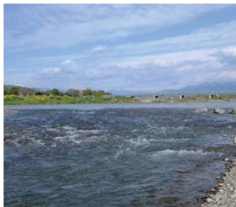
身近な自然環境を守ろう

国土交通省高崎河川国道事務所は、河川のごみの投棄や環境悪化などの状況を報告してもらう河川愛護モニターを募集します。詳しくは、同事務所にある応募要項が同事務所のホームページで確認してください。 ●任期 7月から2年間 ●対象 20歳以上で、烏川・神流川の近くに住んでいる人 ●手当 月額4500円 ●申し込み 5月29日(金)までに、同事務所にある応募用紙に必要事項を記入して、〒370・0841 栄町6の41 高崎河川国道事務所河川管理課 (☎345・