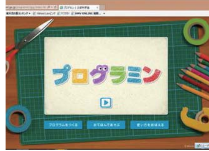
コンピュータを動かす仕組みを学ぶ

経済産業省は、製造業を営む事業所を対象に、従業員数や出荷額などを調べる「工業統計調査」を実施します。5月に調査員が電話かインターネットでの聞き取りを行い、6月に調査票を送りますのでご協力ください。調査結果は、産業政策などに