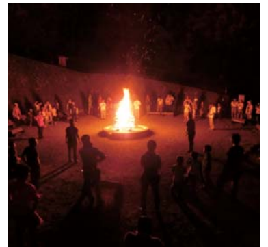
非日常の体験をしよう

初心者親子キャンプ ●期日 7月18日(土)・19日(日)、1泊2日 ●会場 観音山キャンプパーク・ジョイナス ●内容 野外炊飯、キャンプファイアなど ●対象 市内の小学1～3年生とその保護者(2人1組) ●定員 28組(抽選) ●費用 1組3,000円 ●申し込み 6月5日(金)までに、はがきに住所・保護者と子どもの氏名・学校名・学年・性別・電話番号を書いて、〒370-8501 高崎市役所 防犯・青少年課(☎321・1297)へ。