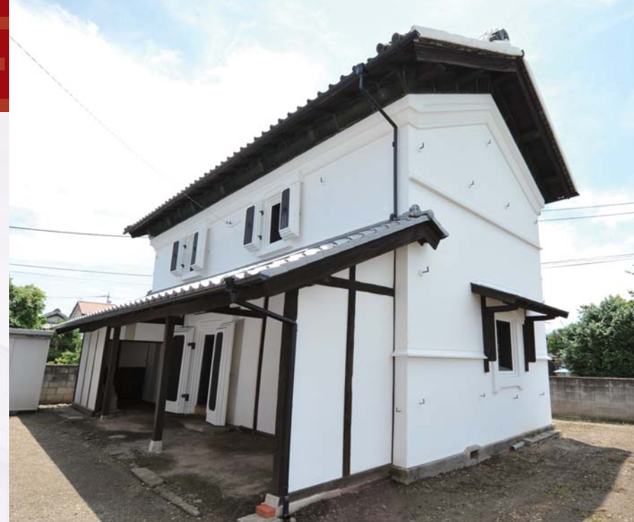
明治時代に国府地区から移築された蔵。まちが変わりゆく中で、100年以上受け継がれてきた