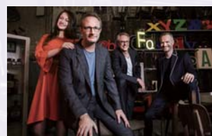
フォーレ四重奏団

●入場料=一般4,000円、25歳以下2,000円 ●チケット= I電窓 販売中