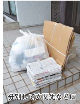
分別して玄関先などに