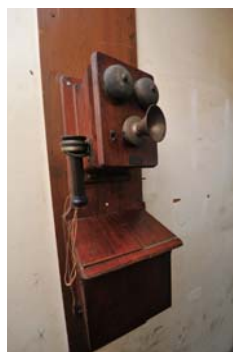
当時の電話機を初公開

市歴史民俗資料館は、国登録有形文化財の登録を記念して、企画展「国登録有形文化財旧群南村役場庁舎～高崎市歴史民俗資料館のもう一つの顔」を開催します。