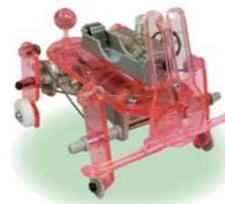
友達と競争してみよう

少年科学館 ☎321・0323 科学工作・パソコン教室 いずれも、時間は午前9時30分～正午です。 申し込みは、締め切り日までに、往復はがきに住所・保護者と子ども(氏名)・学年(シニア向けは住所・氏名)・電話番号・教室名を書いて、〒370-0065末広町23の1 少年科学館へ。教室ごとに1人1枚の応募で、定員を超えたときは抽選します。 メカ・ラビットを作ろう ●期日①10月10日(土) ●会場①創作室 ●内容①モーターの力で動くウサギ型ロボットを作る ●対象①小・中学生(小学3年生以下は保護者同伴) ●定員①18人 ●費用① すめ本の紹介など 特別整理休館 箕郷図書館(☎371・4486)は、館内整理のため10月6日(火)～9日(金)は休館します。