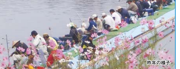
初心者でも気軽に楽しめる

鳴沢湖にワカサギ釣りのシーズンが到来します。 ●遊漁期間=10月1日(木)～来2月28日(日)、午前6時30分～午後4時 ●休業日=火曜日(祝日は開業し、翌日休業) ●遊漁料=1日520円、中学生以下無料 ●釣りボート料金(1艘)=1日2,090円・半日1,570円 ●棧橋使用料=1日大人1,570円・1日中学生以下1,040円・半日大人1,040円・半日中学生以下520円 ●問い合わせ先=鳴沢湖釣場管理事務所(☎371-1124)