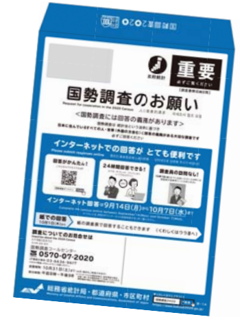
封筒には3種類の書類と提出用封筒が入ってます

9月14日から調査員が訪問。10月7日までに回答を 国勢調査にご協力ください 今年、5年に1度の、国の最も重要な調査・国勢調査が行われます。国勢調査は、日本に住む全ての人に、正確に回答してもらう必要があります。9月14日(月)から、調査員が全ての世帯を訪問し、調査書類を配布します。皆さんのご協力をお願いします。お問い合わせは、情報政策課(☎321-1210)へ。