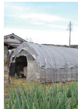
資産を確認し適切に申告を

多胡碑記念館の臨時休館 多胡碑記念館は、9月28日(月)から10月5日(月)まで、資料の薫蒸作業のため休館します。 問い合わせは、同館(☎387-4928)へ。 事業用の資産は固定資産税の課税対象になります 事業のために使う農業用ビニールハウスや太陽光発電設備、アパートの外構設備や自転車置き場などの償却資産は、固定資産税の課税対象です。市内で事業を営んでいる個人や法人で、これらを所有している人は、毎年1月1日時点の所有状況を申告する必要があります。