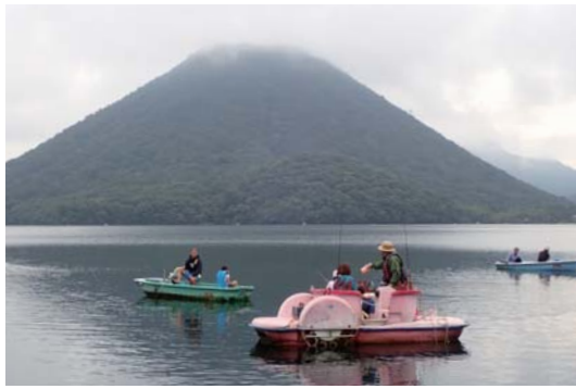
榛名湖のきれいな水で育ったワカサギ

榛名湖のワカサギ釣りが、9月1日から解禁されます。遊漁期間中は休まず営業。秋の涼やかな風を感じながら、ぜひワカサギ釣りをお楽しみください。