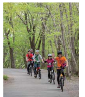
気軽に山道を楽しむ

NPO法人赤城自然塾は、赤城山やその周辺を楽しむ、電動アシスト付きのスポーツ仕様の自転車・e-Bikeの貸し出しを行っています。e-Bikeで赤城山や山麓を巡って、美しい自然や地元グルメを満喫しませんか。貸出場所など詳しくは、同塾のホームページで確認してください。 問い合わせは、同塾(☎027-212-2611)へ。 ●貸出時間 4～9月=午前9時～午後5時30分 10～3月=午前10時～午後4時30分 ●費用=2時間2,000円、4時間3,500円、1日6,000円、1泊2日8,000円(30分延長ごとに500円) ●申し込み=利用日の2日前の午後3時まで、同塾のホームページから応募