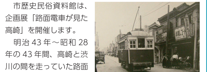
昭和20年代後半の市街地

市歴史民俗資料館は、企画展「路面電車が見た高崎」を開催します。明治43年～昭和28年の43年間、高崎と渋川の間を走っていた路面電車。市民の足として活躍していた路面電車は、当時の高崎の風景に欠かせない存在でした。