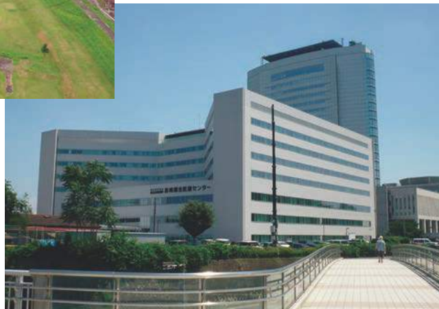
救命救急センター機能を有する高崎総合医療センター