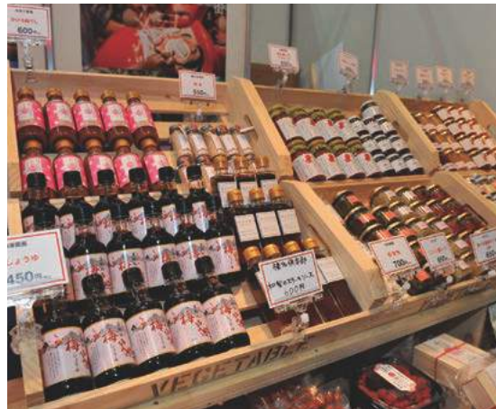
梅をはじめとした農産物の加工品