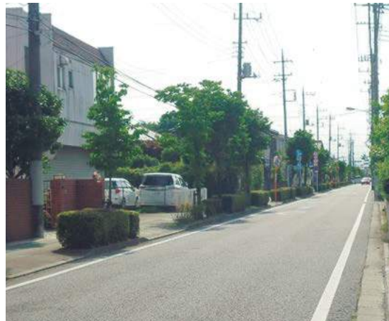
街路の整備で快適な住環境を創出