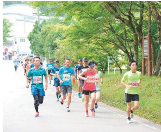
日本一標高の高い公認コースを走る榛名湖マラソン