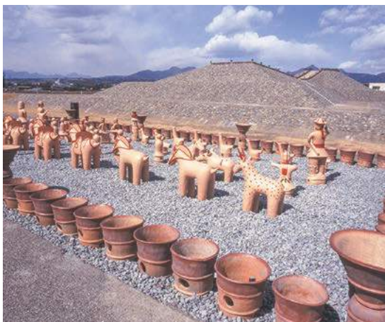
古代東国文化を現代に伝える保渡田古墳群