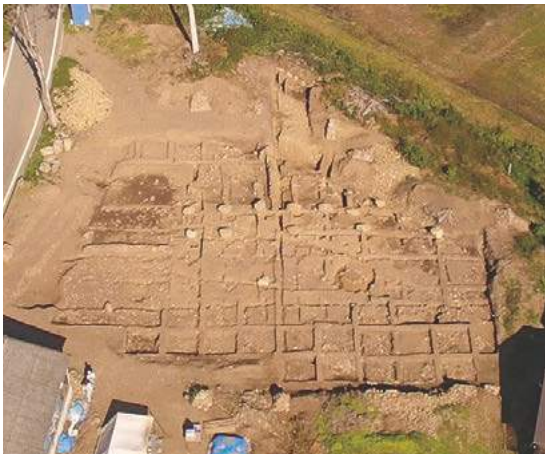
奈良時代の都衙の存在を示す多胡郡正倉跡