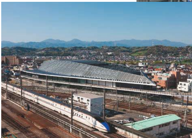
国際大会にも対応できる高崎アリーナ