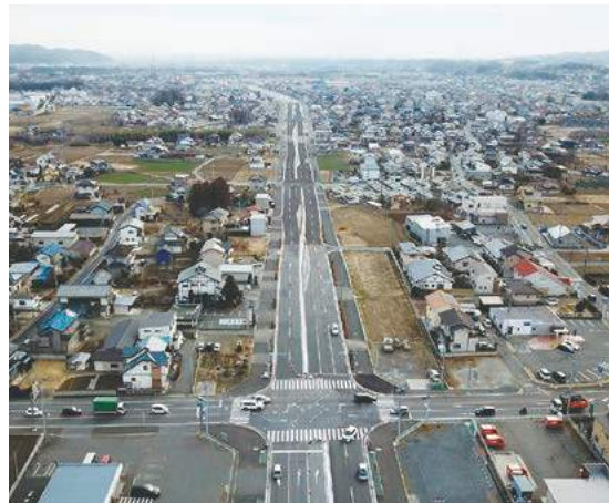
産業振興を後押しする国道254号バイパス