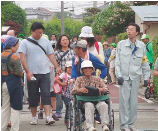
住民参加による水害対策訓練