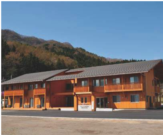
豊かな自然に囲まれたくらぶち英語村