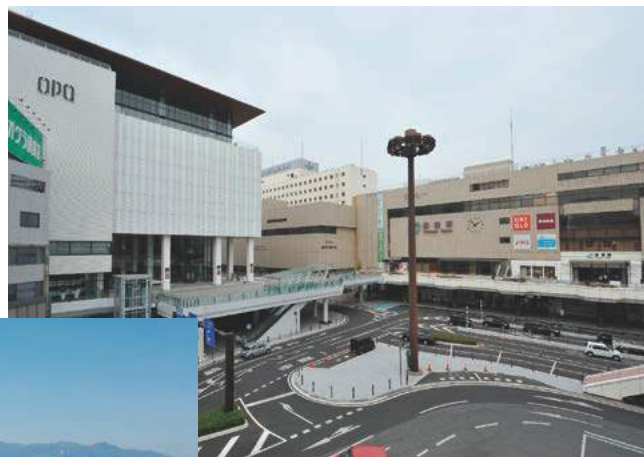
都市機能が集積する高崎駅周辺