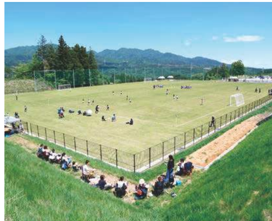
地域の活性化の一翼を担う倉渕サッカー場