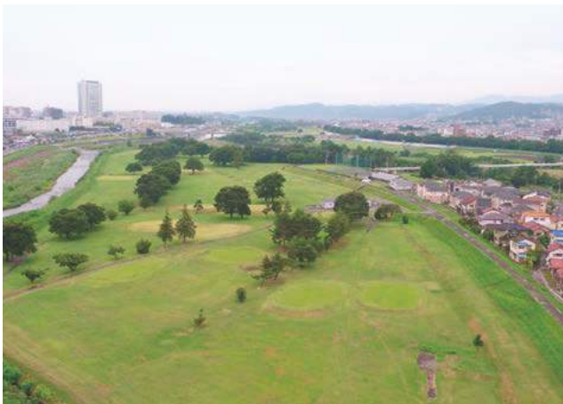
市民生活に潤いをもたらす烏川かわまちエリア