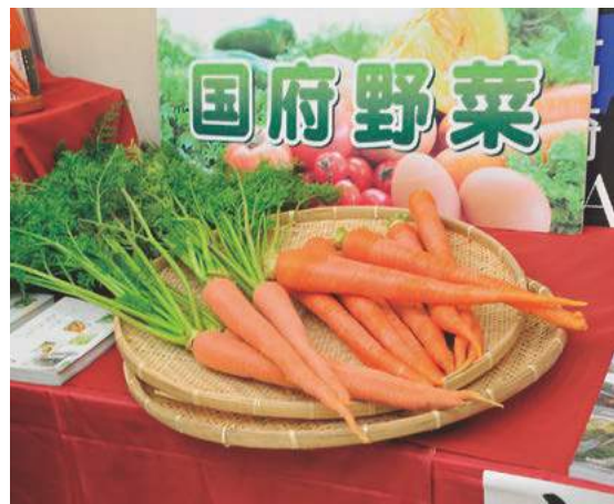
高品質な農産物を地域ブランドとして推進