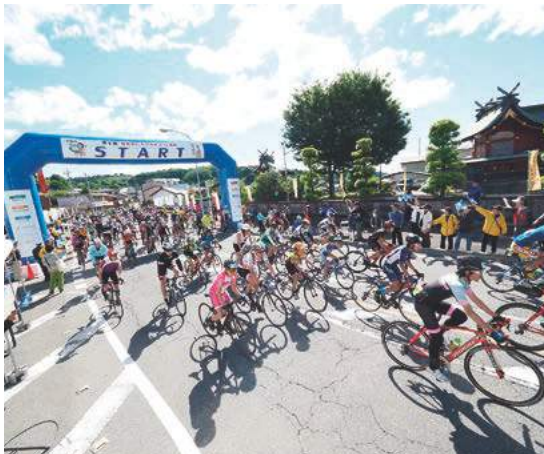
全国から参加者が集まる榛名山ヒルクライムin高崎