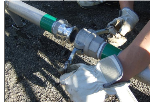
⑤給水スタンド同士をつなぎます(緑色のテープ同士をつなぎます)