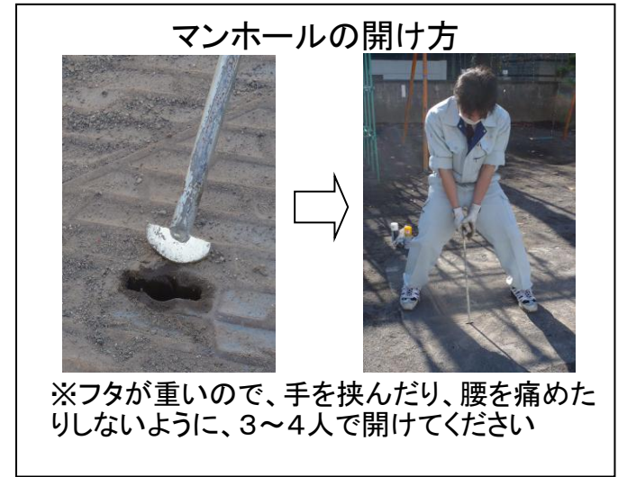
マンホールの開け方

※フタが重いので、手を挟んだり、腰を痛めたりしないように、3~4人で開けてください