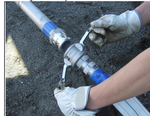
④白ホースと給水スタンドをつなぎます(青色のテープ同士をつなぎます)