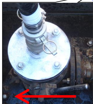
⑥レバーを「O(オー)か開」の方向に倒します