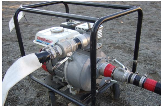
③黒ホースと白ホースをエンジンにつなぎます(同じ色のテープ同士をつなぎます)呼び水を入れて、エンジンをかけます