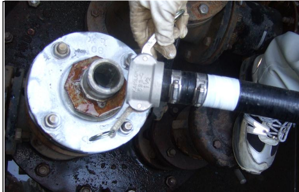
②黒ホース(白いテープが巻かれている方)を取水口(白いスプレー)につなぎます