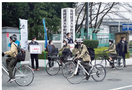
通学時のヘルメット着用 (経大附属高校)

答弁 本市では、自主防災組織の活動や訓練等の支援を目的とした相互協力に関する協定を、日本防災士会