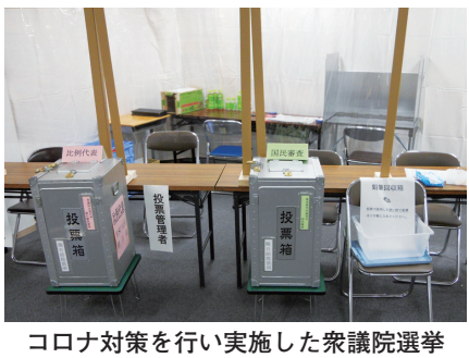
コロナ対策を行い実施した衆議院選挙

答弁 高齢者等の交通弱者への足の確保は重要な課題であることから、高齢化率の高い地域や急な傾斜地などで事業を開始した。事業