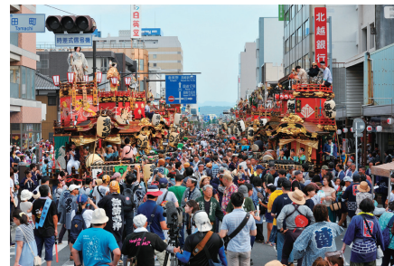
熱気を帯びた高崎まつり (平成30年)

学校や地域の特別な事情がある場合、生徒の興味や関心に応じて空手道等を加えることもできると示されており、本市も1校で空手道