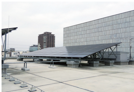
温暖化対策で設置した太陽光発電設備

答弁 本市では、高崎市第4次環境基本計画に基づき、地球温暖化対策を行っている。温室効果ガスの排出量は、東日本大震災の影響により増加傾向に転じたが、その後、再エネの普及や省エネ技術の進歩などにより減少している。平成30年度