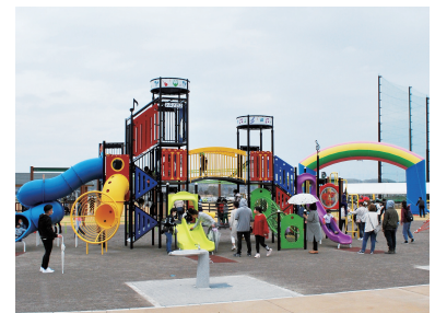
一部開園した吉井中央公園

答弁 防衛省に野球場整備に係る経費を令和4年度予算として要望していたが、令和3年度での補助金内示があったため、補正予算に計上した。