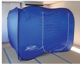
購入予定のルームテント

答弁 避難所の停電対策やプライバシーの確保を図るため、カセットボンベ式の発電機、LED投光器、コードリール、ルームテントなどの資機材