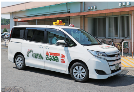
おとしよりぐるりんタクシー

質問 高崎354複合産業団地の整備の目的は。また、市場の南にある流通センター運動広場の今後の扱いは。 答弁 高崎スマートインターチェンジ産業団地に続き、さらなる企業の誘致を図り、