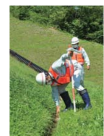
危険箇所総点検の様子

危険箇所総点検の結果を踏まえた土砂の撤去や側溝の整備など、雨水対策工事に係る経費。 6090万円