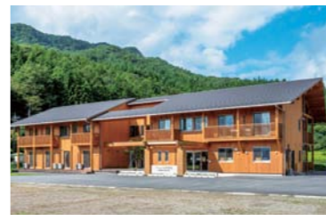
計画内の特別事業に当たるくらぶち英語村

旧倉淵村の区域の持続的発展を図るため、令和3年度から8年度までの計画を策定する。地域住民が豊かな生活を送ることができ、地域整備を目指すことで、地域の持続的な発展を促進することを基本方針とする。