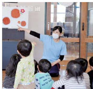
保育士が仕事をする様子

後で推移し、コロナ禍の令和2年度も約3万1千人が来園した。近年では、自然観察会や里山探検などを実施し、自然体験の中で植物に目を向ける事業を充実させ、植物と染色をつなげるアプローチをしている。 質問 イベントを映像化した 質問 産休等代替職員補助金を廃止した理由は。 答弁 産休等代替職員補助金は、保育所等が産休者と代替職員双方の給料などを支払う場合の補完制度であるが、公的保険制度における出産手当金の拡充に伴い、多くの施設が手当金制度に移行している。令和2年度の補助金制度の利用は、約80施設中5施設にとどまり、県、前橋市と同様に令和3年度より廃止した。