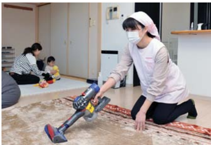
子育てSOSサービス事業による支援

答弁 高崎市コロナワクチン問合せ電話では、予約が困難な高齢者に予約方法を説明するなど、接種に関する相談に応じており、さらに、保健所や各支所の職員による予約手続きの支援も案内している。引き続き、希望者が速やかに接種できるように取り組んでいく。