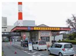
処理施設でごみを搬入する様子

答弁 各処理施設に直接ごみを搬入する際の手数料の計算方法を改定するもので、現行の条例では100キログラムを超えるごみを搬入する際、総重量に対して手数料が発生していたが、改正後は総重量ではなく超過分に対してのみ手数料が発生するようになる。