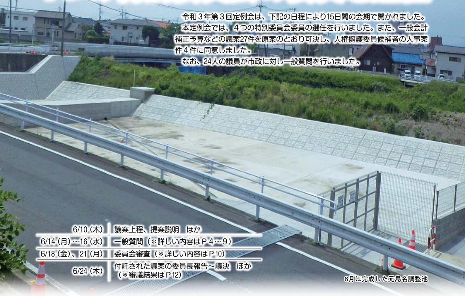
6月に完成した元島名調整池

令和3年第3回定例会は、下記の日程により15日間の会期で開かれました。 本定例会では、4つの特別委員会委員の選任を行いました。また、一般会計補正予算などの議案27件を原案のとおり可決し、人権擁護委員候補者の人事案件4件に同意しました。 なお、24人の議員が市政に対し一般質問を行いました。