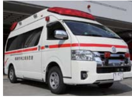
購入するものと同規格の救急車

答弁 前回の購入では、車両に設置されている無線機も同時に更新したが、今回は現在使用しているものを再利用するため、無線機の方が低額となっている。