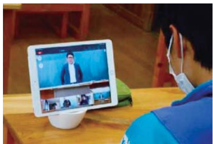
端末を活用した離れた場所での交流