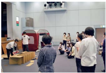
人材育成推進チームの研修会

質問 二酸化炭素排出削減の取り組みの一環として、 市有施設の電力を再エネ100%に切り替える考えは。