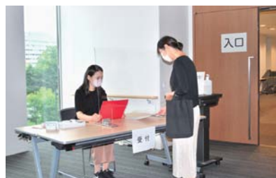
集団接種会場の受付

新型コロナウイルスワクチンを64歳以下の対象者へ接種するための費用など、追加で必要となる経費。