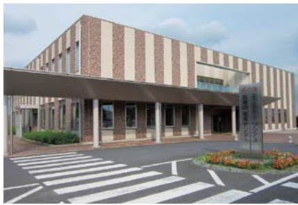
市内8カ所にある教育支援センター

答弁 本市では、部活動の質的向上と教職員の負担軽減を目的として、部活動指導員を各校に配置している。さらに、民間の運動実技経験者を部活動体育実技指導協力者として派遣している。各学校からは、苦手な分野の指導を行う教職員の心理