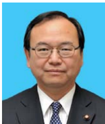
さかがわ よしひさ 逆瀬川 義久 (公明党)