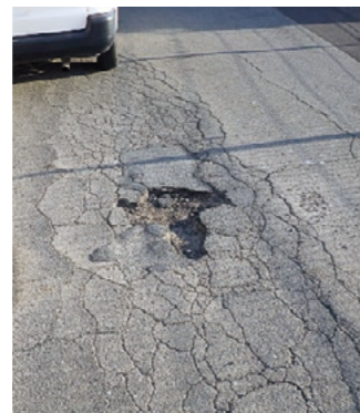
穴ぼこなどの改修を集中的に実施