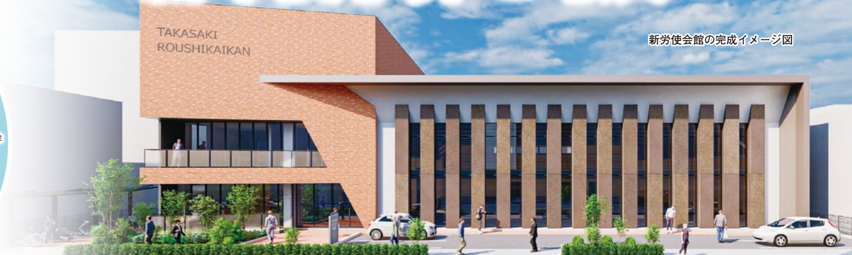
新労使会館の完成イメージ図

令和5年第1回定例会は、下記の日程により24日間の会期で開かれました。 本定例会では、市長が新年度予算についての施政方針や概要を示し、これに対し各会派の代表者が総括質疑を行いました。新年度予算などの議案46件を原案のとおり可決し、固定資産評価審査委員会委員及び人権擁護委員候補者の人事案件8件に同意しました。なお、請願2件は不採択、意見書案1件は可決となりました。 また、19人の議員が市政に対し一般質問を行いました。