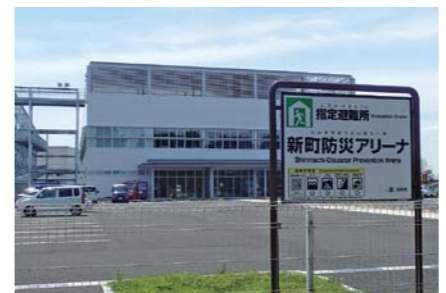
指定避難所の表示板