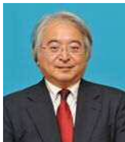
教育長職務代理者