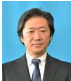
教育長職務代理者