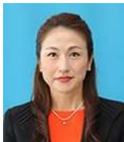
教育長職務代理者