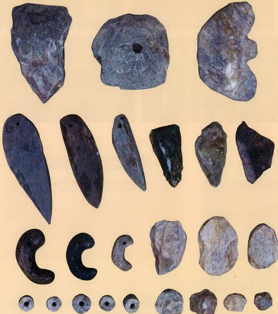
高崎市内出土の石製模造品