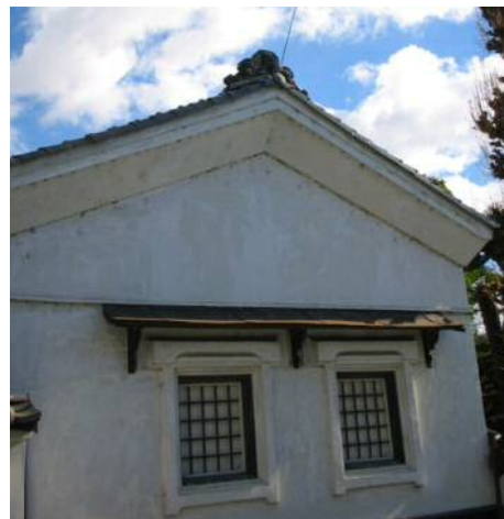
B 白壁の土蔵。窓に鉄格子がついているのは通りに面してるから。この通りを北へ登って行くと箕輪城へ