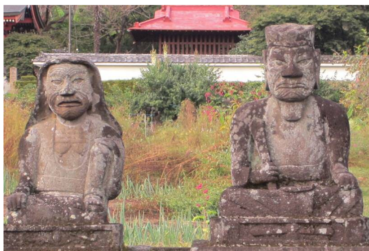
C 閻魔(えんま)大王と脱衣婆(だつえば)〜こっちをにらんでる？ 結構大きくて、迫力があるよ