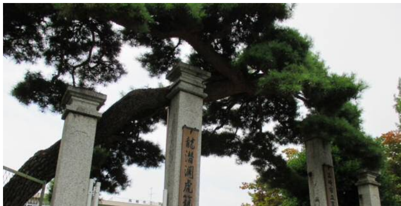
A 学校の門柱と門かぶりの松 こんな立派なものなかなか見られないよ 日本百名城・箕輪城のある町にふさわしいね