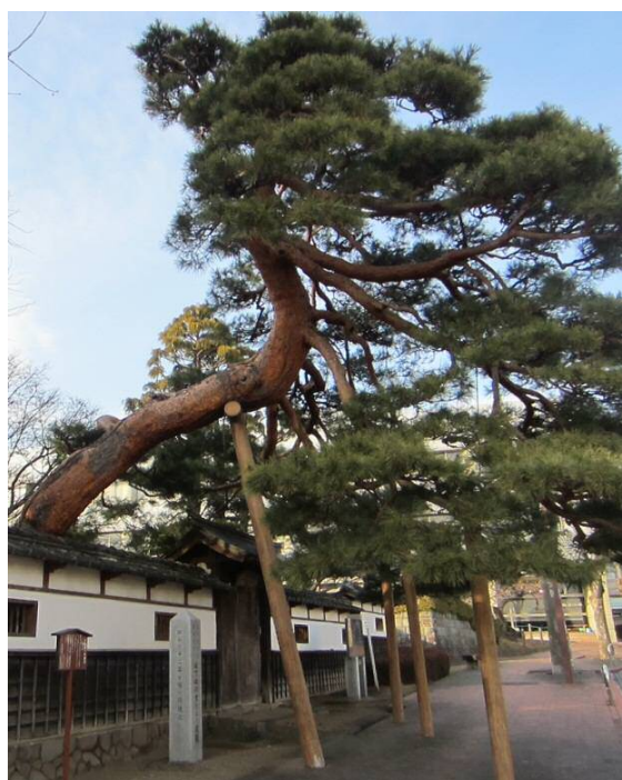
E 大きな赤松がところせましと塀から乗り出している この中は、江戸時代から残る日本庭園