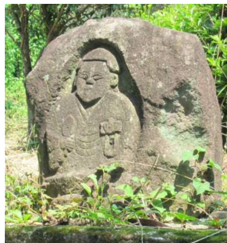
F ずんぐりむっくりでちょっとユーモラスな石仏がある このお寺は、昔は箕輪城まで含む大きな敷地を誇ったという