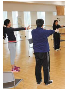
体を動かして気分転換

●日時II4月9日(火)午前10時~11時30分 ●会場II市総合保健センター4階運動室 ●内容IIストレッチ体操をして楽しく体を動かし、健康増進を図る ●持ってくる物IIタオル、体育館シューズ ●締め切り日II4月5日(金) ●日時II4月12日(金)午後1時30分~3時30分 ●会場II市役所17階17会議室 ●締め切り日II4月10日(水)