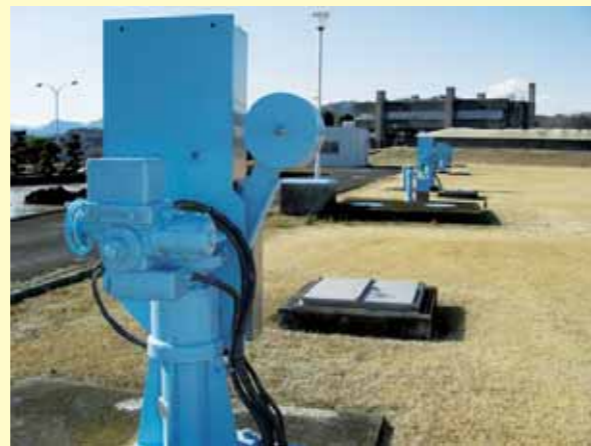
若田浄水場に設置されている緊急遮断弁

現在市内の水道施設には18機の緊急遮断弁が設けられ、約5万8千トンの水が確保できるようになっています。この量は全市民1人につき約170リットル、10日間の給水が可能な量となります。