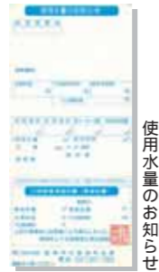
使用水量のお知らせ