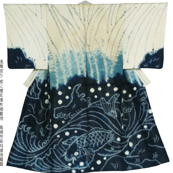
浅舞絞り波に鯉文様木綿着物 ※全期間展示します