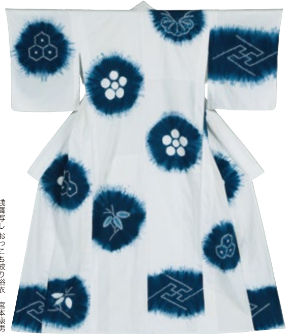
浅舞写しおこち絞り浴衣 宮本康男 ※前期展示となります

【③電子メール】件名に講習会名と開催日を明記し、本文に上記(ア)と発信元のメールアドレスを書いてお送りください。(宛先：senryou@city.takasaki.gunma.jp)。 ※添付ファイルのあるものは受付できません。