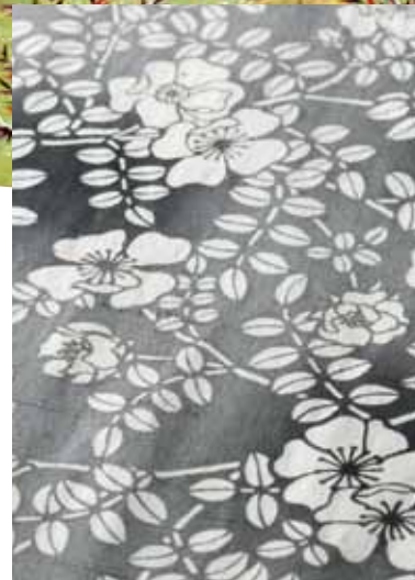
《松煙染布見本(部分)》制作:篠崎節 ※松の木を燃やした煤で染めたものです