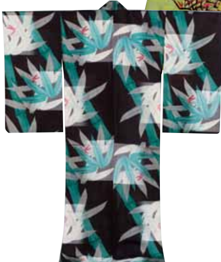
《黒地竹に蜻蛉模様単衣》須坂クラシック美術館蔵