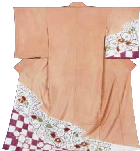
山崎青樹《辻が花訪問着 桜藤石畳文》(再現品) 個人蔵 ※この着物の地色は梅の枝を煮出した染液で染めたものです