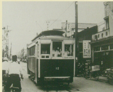
田町 富田屋前(昭和27年頃)