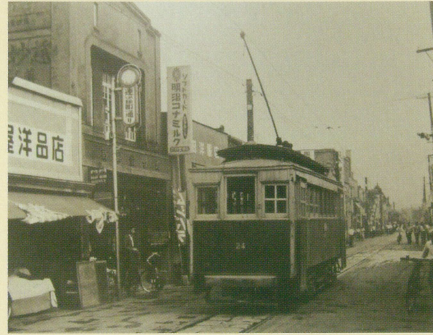
連雀町 一文字屋前