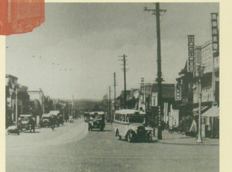
高崎駅前から西方を望む