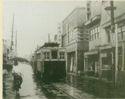
新町(あら町) 金子写真館前(昭和27年頃)