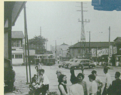
高崎駅西口 駅前広場