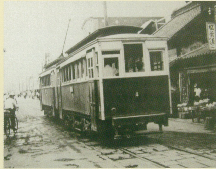
新町(あら町) 一文字屋前(昭和27年頃)