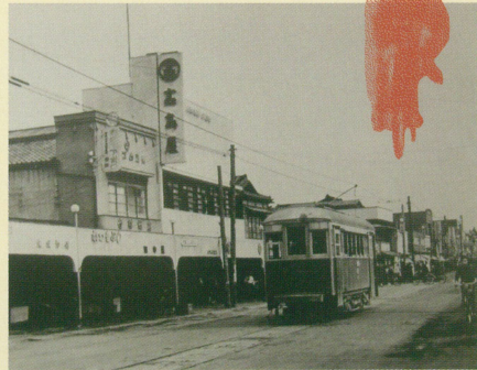
連雀町 日英堂前・大手前のりば