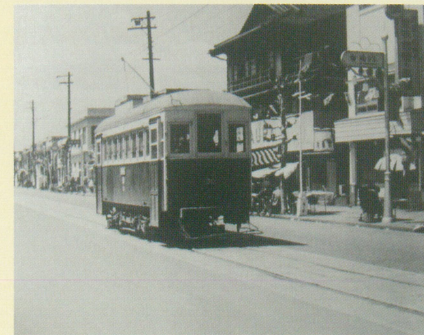
高崎駅前通り(昭和28年)