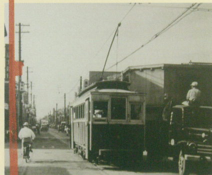
田町 富士銀行前(昭和27年頃)