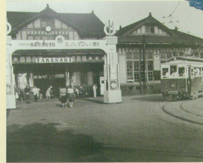
高崎駅前西口正面(昭和25年)