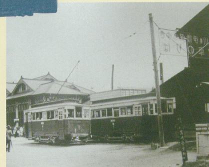
高崎駅西口前 渋川の伊香保ゆき電車のりば(昭和27年頃)