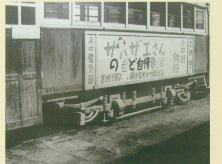
映画「サザエさん」の宣伝をつけて(昭和25年)