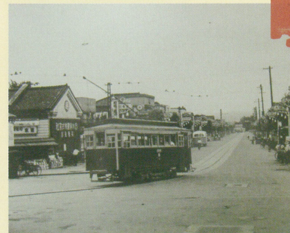
高崎駅前通りを走る渋川行き電車(昭和28年)