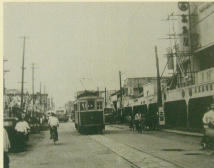
連雀町 高島屋前通り(昭和27年頃)