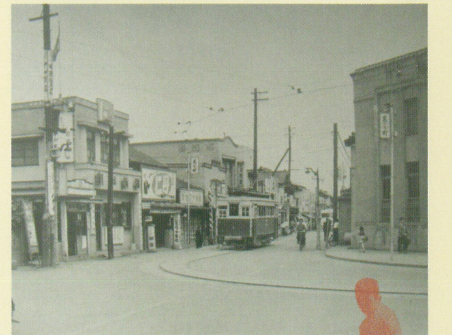
新町(あら町)T字路(昭和28年)