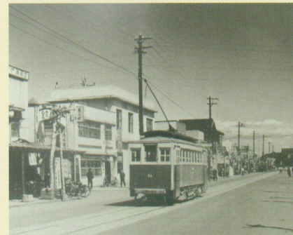
駅前通り 駅に向かう(昭和27年頃)