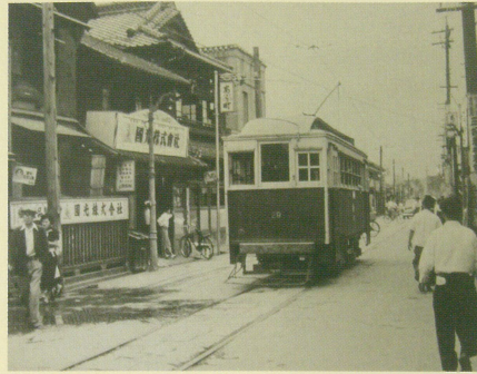
新町(あら町) 國光前(昭和27年頃)