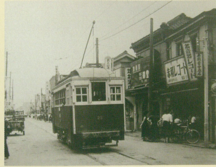
新町(あら町) 赤羽レコード店前(昭和27年頃)