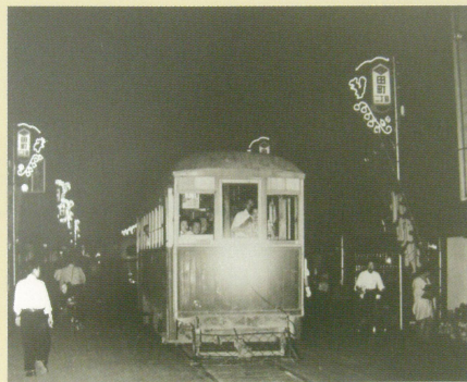
田町 2丁目を走る夜の電車