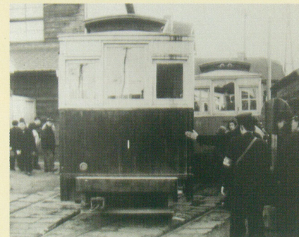
高崎駅前駐車場で