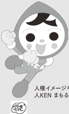
人権イメージキャラクター 人KEN まる君