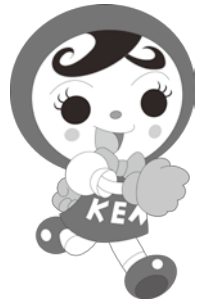
人権イメージキャラクター 人KEN あゆみちゃん

神奈川県川崎市出身。13歳で脊髄炎発症、両下肢麻痺となる アトランタ、シドニー、アテネ、北京と夏季パラリンピック大会に出場(競泳) 金15、銀3、銅2と計20個のメダル獲得 その功績により、内閣総理大臣賜杯、内閣総理大臣顕彰、パラリンピックスポーツ大賞 (最優秀女子選手賞)など数々の賞を受賞 2016年リオパラリンピックに出場し、個人3種目で日本新記録(50m背泳はアジア新記録)。 講演を通じ、障害者や障害者スポーツの周知活動を続ける 公益財団法人東京オリンピック・パラリンピック競技大会組織委員会理事、川崎市市民 文化大使、公益財団法人笹川スポーツ財団評議員、NGBC(NEW GENERATION BAKERY CLUB)理事