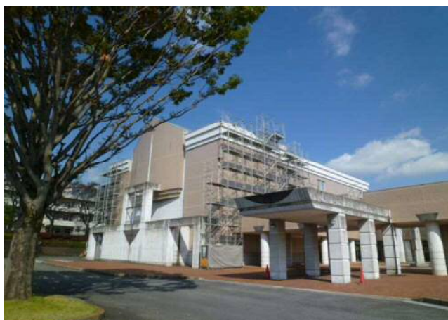
屋根防水工事に伴う作業足場設置 (ホール棟)