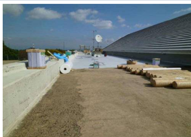
ホール棟屋根防水工事作業の様子