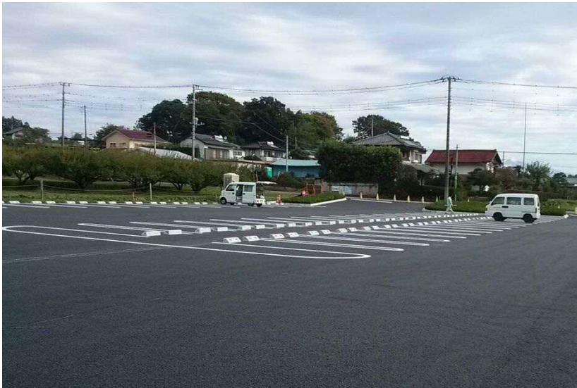
箕輪城跡駐車場整備工事(西から)