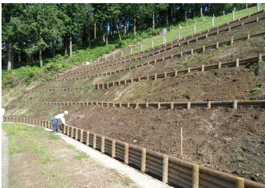
急傾斜部分土留工事