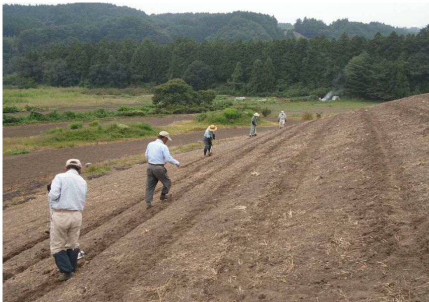
花園ゾーン播種作業