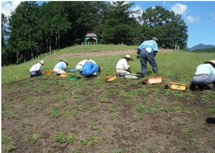
芝桜公園除草作業