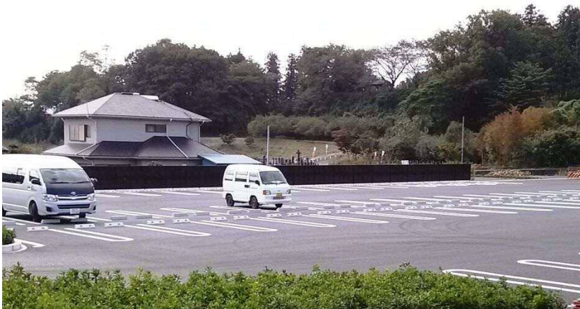
箕輪城跡駐車場整備工事(北から)