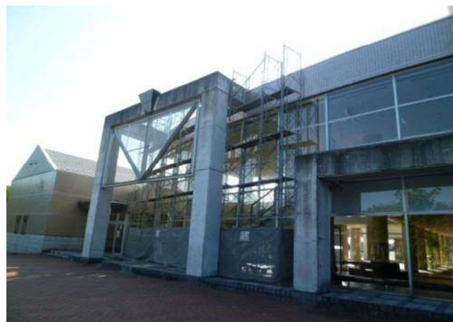
屋根防水工事に伴う作業足場設置 (みねはら公園側ロビー壁面)