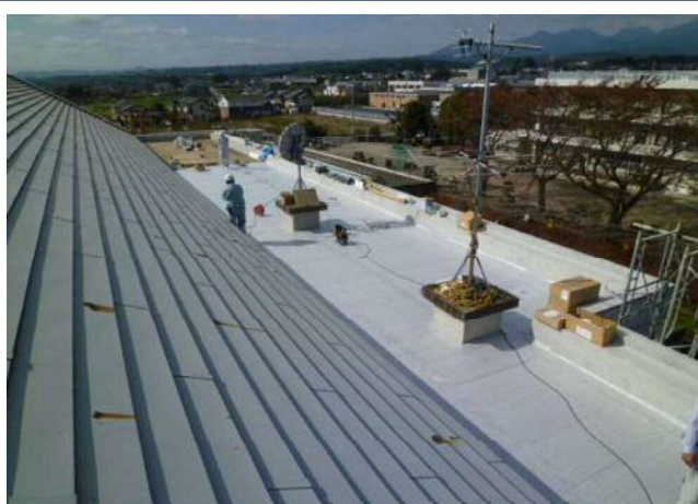
ホール棟屋根防水工事作業の様子