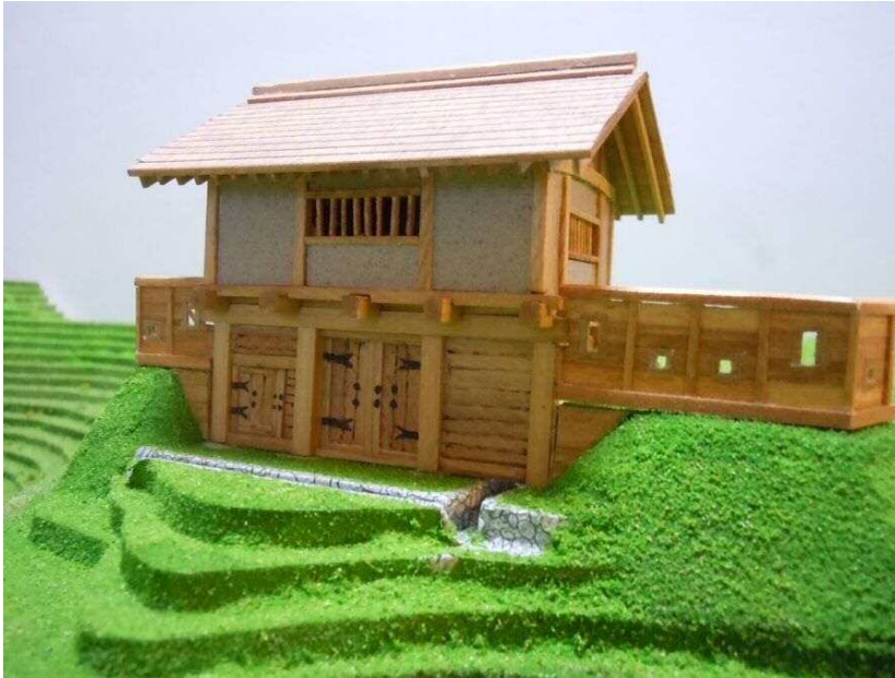
箕輪城・郭馬出西虎口門の完成予想模型(26年度から工事着手)