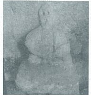
③小暮の穴薬師部分(高崎市吉井町小暮) (穴薬師横穴墓、石像は鎌倉期と推定)