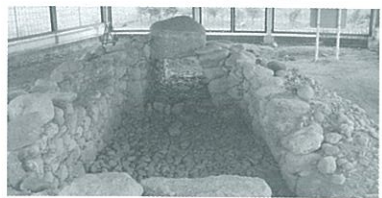
②山名原口II号古墳(高崎市山名町)