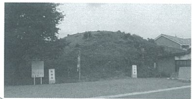
①漆山古墳(高崎市下佐野町)