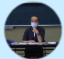
中居リアンの山田さん