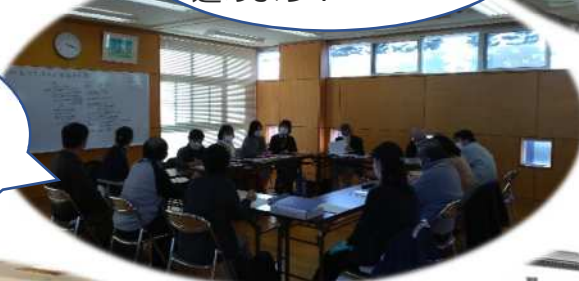
京ヶ島・澁川地区