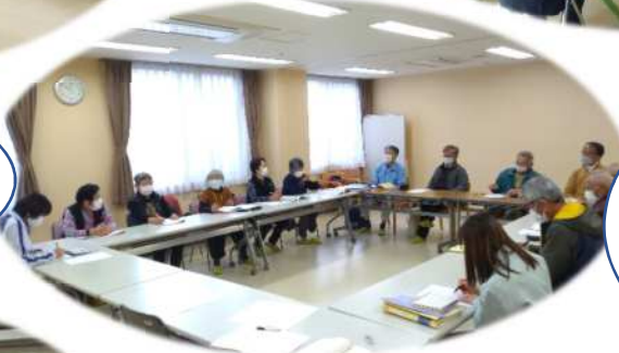
群馬地区（なのはな）

ぐるりんタクシー を活用していこう！ タクシーとルートに ある居場所を つなげよう！