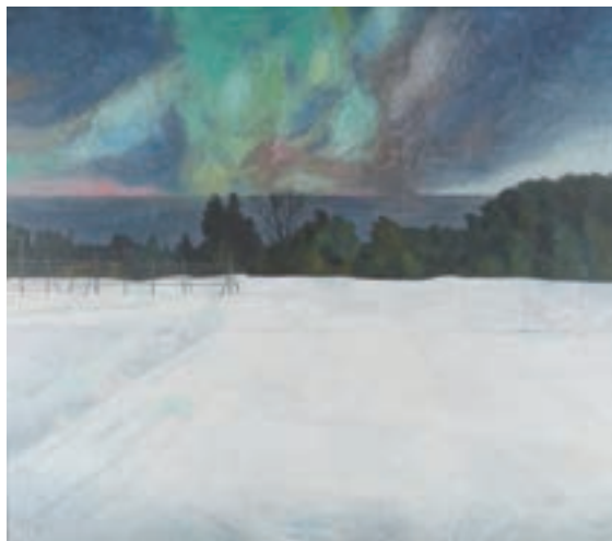
鈴木竹柏《雲と雪》1980年