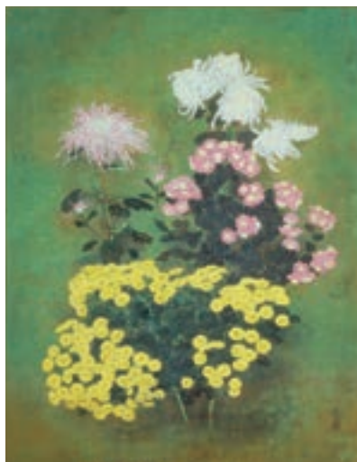
山本真也《庭の秋》1991年 寄託作品