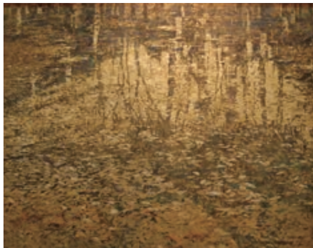
角田信四郎《秋映》1995年 寄託作品