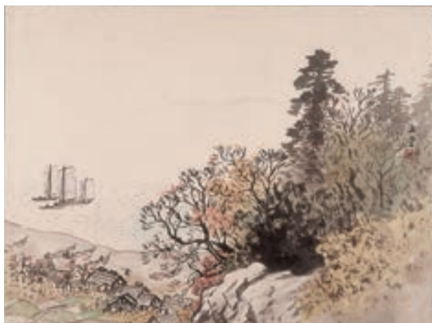
川合玉堂《湖村秋晴》寄託作品