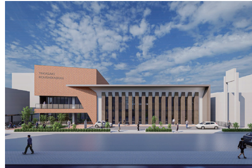
労使会館の建て替え（労働費）