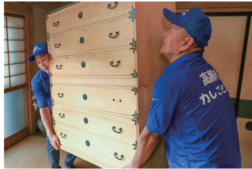
高齢者世帯などの力仕事をお手伝い（民生費）