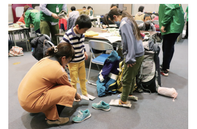
新聞紙でスリッパ作りなども

中央公民館は、避難所での生活を疑似体験して、親子で防災への理解を深める講座を開催します。持ち出し袋の確認や防災グッズ作り、非常食の試食なども行います。 ●日時= 3月3日(日)午前10時～午後0時30分 ●会場= 中央公民館 ●対象= 市内の小学3～6年生と保護者(2人1組) ●定員= 10組(抽選) ●費用= 無料 ●申し込み= 2月14日(水)までに、電話で同館(☎027-322-8605)へ