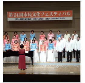
活動の成果を発表

いづれも、入場料は無料です。 問い合わせは、文化課 (☎027・321・1203) へ。