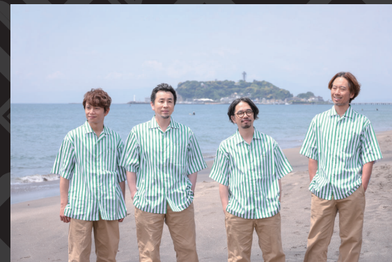
ASIAN KUNG-FU GENERATION

TAGO STUDIO TAKASAKI は、3月16日(土)・17日(日)に音楽イベント「TAGO STUDIO TAKASAKI MUSIC FESTIVAL 2024」を開催します。16日は全国のアマチュアミュージシャンが出演するオーディションを実施。17日には、優勝者と ASIAN KUNG-FU GENERATION によるスペシャルライブを開催します。今回号では、スペシャルライブの市民優先エリアの観覧者募集などについてお知らせします。問い合わせは、観覧者募集問い合わせ専用ダイヤル (☎ 027-331-9083) へ。