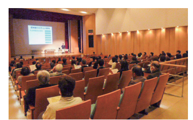
制度について分かりやすく解説

NPO 法人市民後見プラザぐんまは、認知症などで判断能力が低くなった時に支援を行う「成年後見制度」に関する講演会を行います。 ●日時=3月9日(土)午後1時～4時 ●会場=中央公民館 ●内容=弁護士による講演「高齢者にとっての就労と法的支援」、社会福祉士による講演「成年後見制度について知ろう」 ●定員=先着100人 ●費用=無料 ●申し込み=当日直接会場へ ●問い合わせ先=同プラザぐんま(☎080-9265-0763)